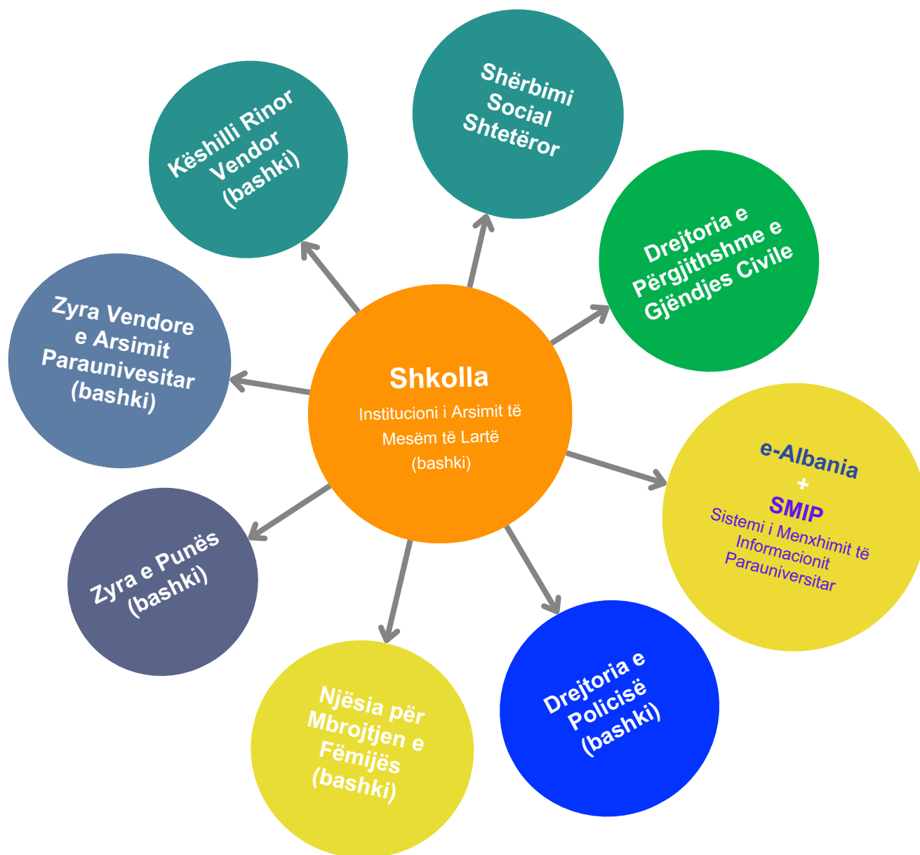
Grafik 1: Lista e institucioneve në nivel vendor të cilat mund të përfshihen në identifikimin e fëmijëve që braktisin, apo janë në rrezik të braktisin shkollën